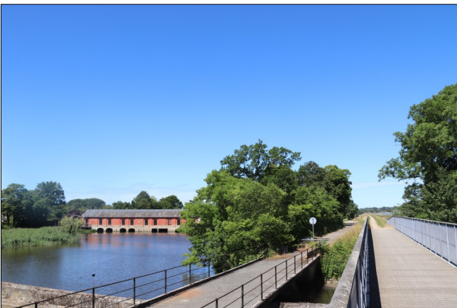
Audebo Pumpestation og Audebodæmningen

Vores landsforening By og Land har bemyndigelse til at indstille bygninger, haver og kulturlandskaber til fredning. I denne sag vil de skrive en anbefaling om fredning, så snart kommunen har overvejet færdig.