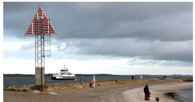
Færgen passerer stranden ved Blegstrædehage i Holbæk Havn