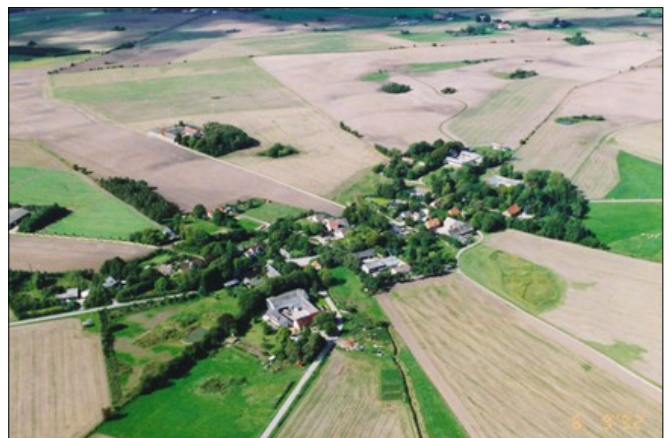
Luftfoto af Bukkerup set fra sydøst.

Kommuneplanen har ingen øvre grænse for, hvor stort et samlet areal, en solcellepark må være. I 2022 kom kommunens forslag til retningslinjer for solcelleanlæg, og netop her ankede vi over, at der ikke var en øvre grænse. På et borgermøde herom blev der spurgt til arealstørrelser, og her blev der fra kommunen svaret, at anlæggene som udgangspunkt ikke må være mere end 100 ha.