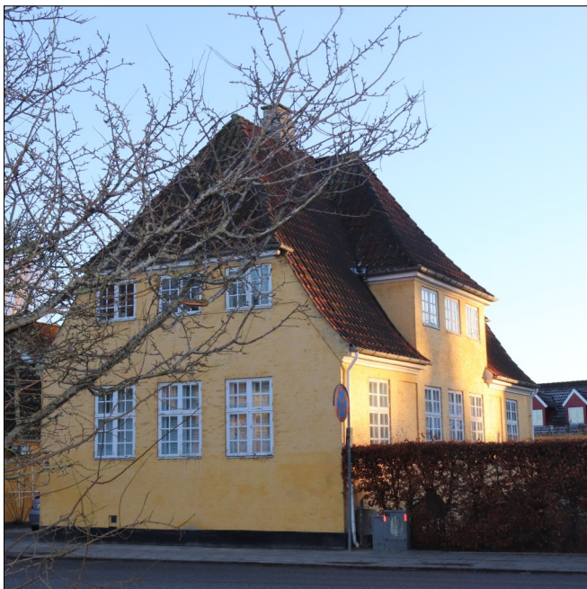
En af de smukke bevaringsværdige bygninger på Jernbanevej i Holbæk.